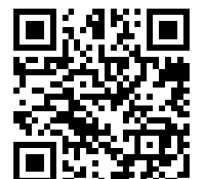
MIC Card Benefits

Step 5: Check your email (and spam if not in your inbox) for the activation confirmation that includes a PDF copy of your card with your name and expiration date. The plastic card will work as well for museum entrance. Always have a photo ID with you when using your MIC card. Use this link for information on all the benefits of the MIC card and a list of museums and sites you can enter for free with your activated MIC Card: MIC card | Portale dei Musei in Comune (musei.incomuneroma.it)