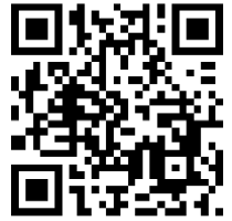
MIC card activation

Go to this webpage: Gift Card - MIC Card . Scroll down to and click on the box for “Attivala ora”: